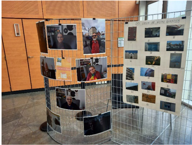
Exposition photo – Fête de la citoyenneté

Vaulx-en-Velin : mettre en évidence les solidarités vaudaises et le sentiment d'appartenance au quartier.