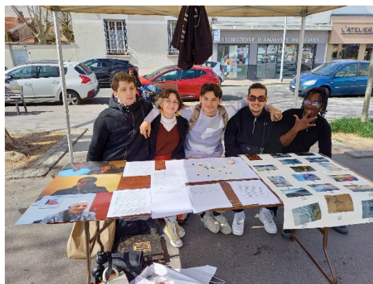
Fête du printemps