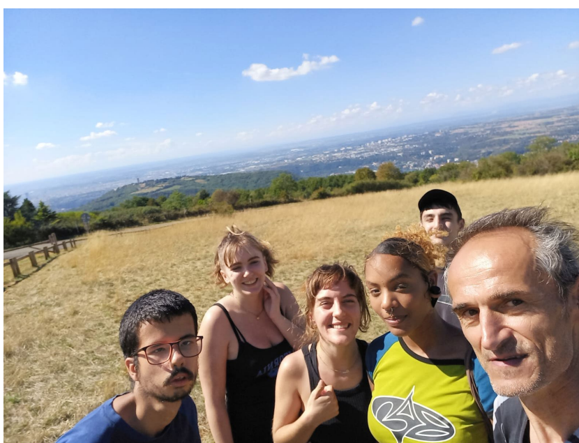
Journée randonnée sur les hauteurs de Lyon

Par ailleurs, les jeunes des derniers programmes ont montré de réels aléas de santé et d'hygiène de vie : la sédentarité, l'alimentation, le sommeil sont devenus des problèmes qui impactent l'engagement et les perspectives des jeunes dans leurs projets notamment d'études ou professionnels. C'est pourquoi, un travail est en cours au sein du programme pour inciter les jeunes au mouvement, à l'activité physique même modérée, les intéresser à une alimentation plus saine, et à être à l'écoute de leur corps. Des attaches ont été prises avec des professionnels du sport et du coaching, des associations en lien avec l'alimentation durable, ou la reconnexion avec la nature, afin de proposer des ateliers et mises en actions au sein des écoles buissonnières.