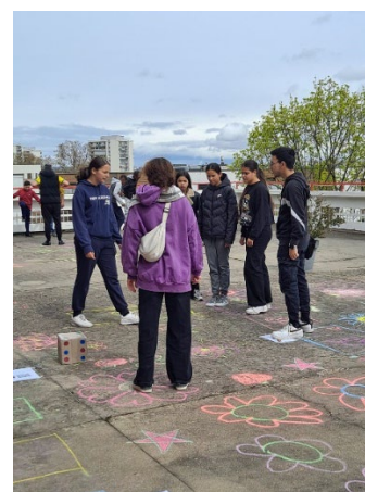
Jeu de l'Oie

Lyon 8 – Langlet-Santy : initier « une collecte des mémoires de nos aînés » des quartiers de Langlet-Santy et La Plaine Santy, afin de parfaire notre connaissance de l'évolution de ces quartiers à travers des interviews. Une mission menée en binômes par les jeunes volontaires, au domicile des personnes âgées, en Ehpad où dans un lieu tiers facilité par notre partenariat avec l'association de quartier « Bien vivre ensemble à Monplaisir ».