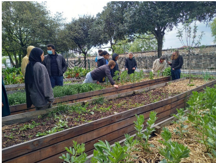
Visite et travail au Jardin de la Sarra avec l'association Gaïa