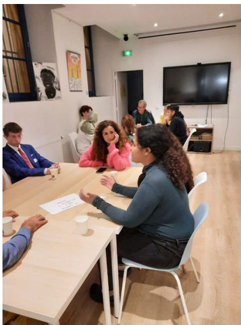
Atelier Rencontre avec des bénévoles