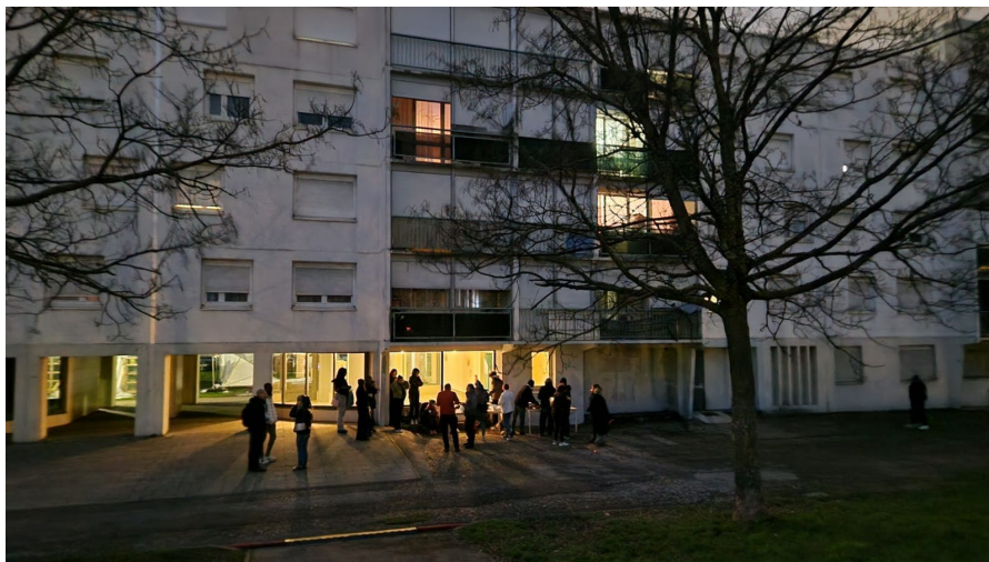
Ateliers cuisine avec le collectif « Femmes du Soleil » de St Priest, Dégustation et distribution en pied d'immeuble