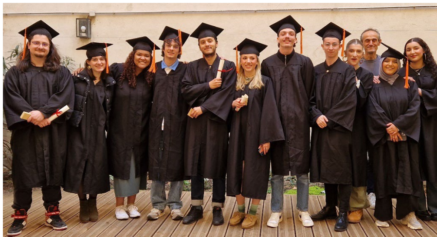
Cérémonie d'engagement des Zinzinous