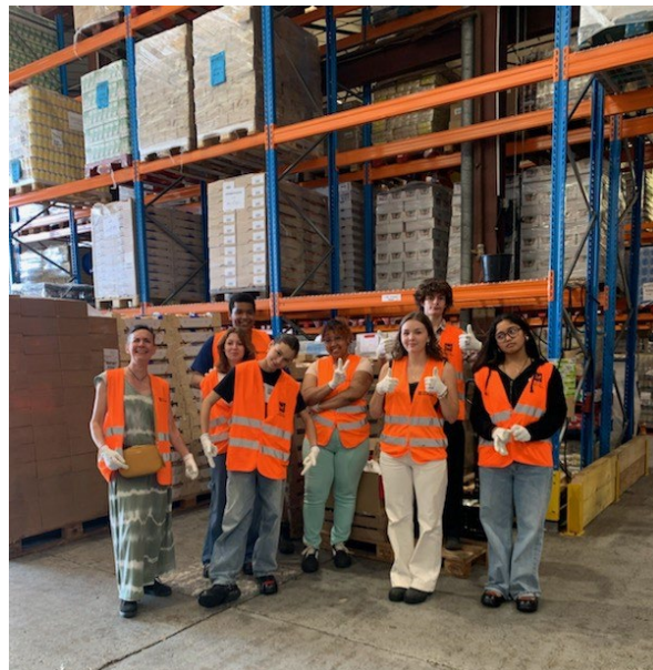
Action de tri à la Banque Alimentaire