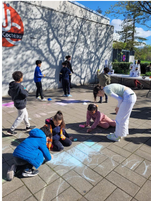
Animation pour les enfants de la Maison de quartier Claude Farrère Et de la MJC Jean Cocteau