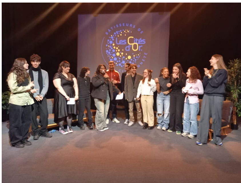
Tremplin Eloquence avec Les Artpenteurs : 5 séances de travail préparatoires au Tremplin organisé au Centre social Pierrette Augier Lyon 9 (avril 24). Sur la thématique de l'engagement, chaque volontaire travaille un texte d'inspiration personnelle et le présente devant un public. Le travail d'écriture et de mise en voix est accompagné par un auteur comédien de la compagnie.