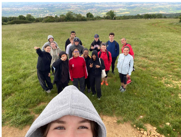
Randonnée au Mont Thou